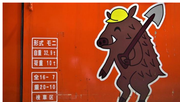
モニ1形に描かれたイノシシのモーニーくん